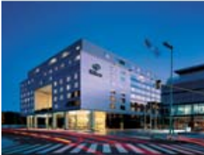
The Hilton, Buenos Aires venue of the IFLA 2004

El aumento de publicaciones en línea de todo tipo ha elevado la necesidad de soluciones de gestión de recursos electrónicos que puedan integrar los servicios de acceso y admitan el control durante su uso. Los aspectos relacionados con la autenticación y la autorización son parte fundamental de la solución.