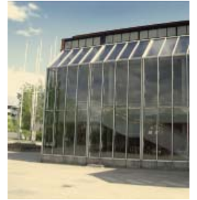
Lugar - el Järvenpää Hall, Järvenpää, Finland.