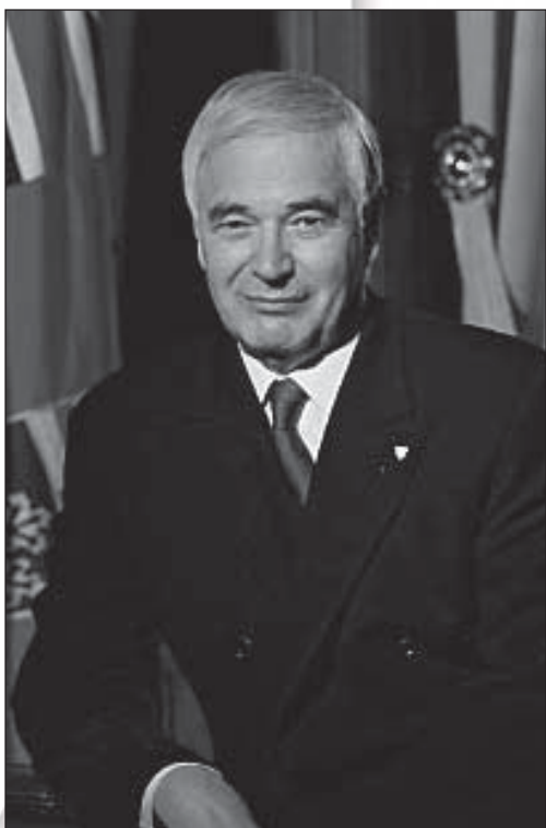
Der ehrenwerte James K. Bartleman

Heute, 13. August 2008 um 12.45 Uhr in Raum 2000bc