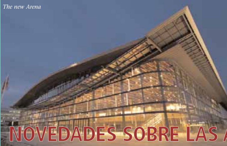
The new Arena

CONGRESO MUNDIAL DE BIBLIOTECAS E INFORMACIÓN ▶ 73 Congreso General y Consejo de la IFLA ▶ Sudáfrica, 19-23 de agosto de 2007