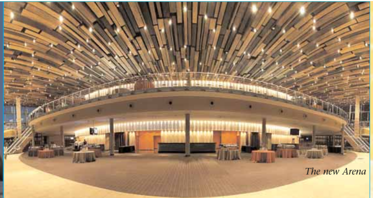
The new Arena